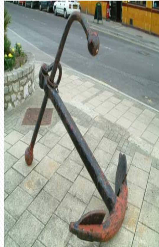
Âncora (Fácil mudança de posição)