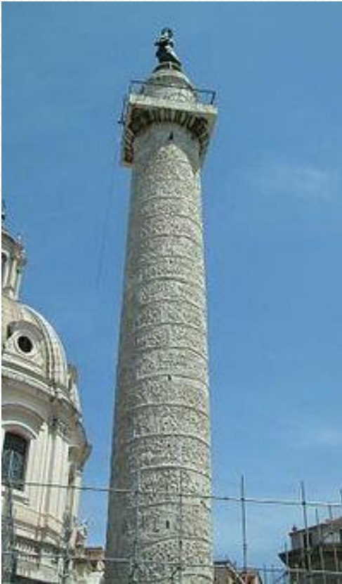
Coluna (Objetivo fixo)